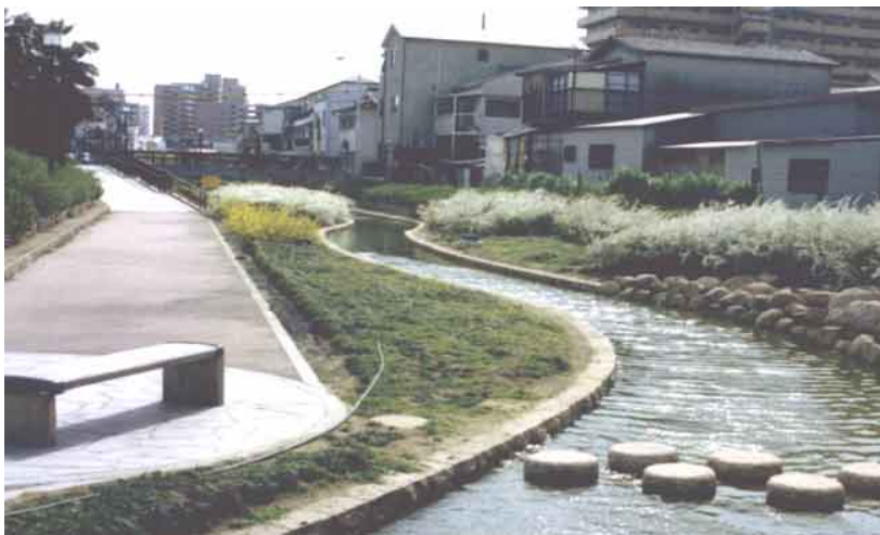
内川緑地せせらぎ水路