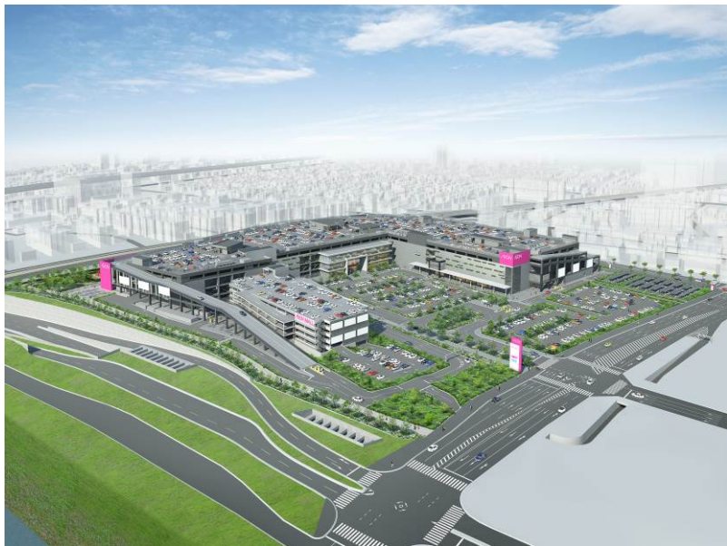
(仮称) イオンモール堺鉄砲町イメージ図